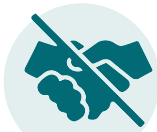
Schud geen handen