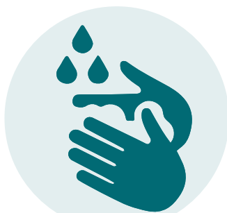
Was je handen regelmatig