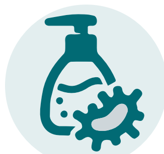
Maak gebruik van de ontsmettende middelen

Zo kunt u optimaal genieten van uw bezoek aan onze brasserie!