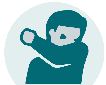
Nies en hoest in je elleboog